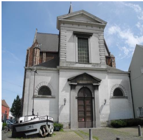
Heilig Kerst vandaag