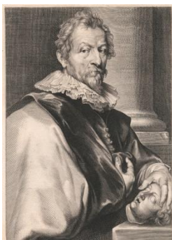
Portret van Hendrik van Baelen door zijn leerling Antoon van Dijck

Wat verder bevindt zich de mooi ingerichte kapel van de H. Jozef. Deze kerk werd trouwens in 1604 door de aartshertogen Albrecht en Isabella aangeduid als zetel van de Broederschap (confrérie) van de H. Jozef. Bij die gelegenheid schonken de vorsten aan de kerk de 7 schilderijen van Hendrik van Baelen (1575-1632) die in deze kapel hangen. De schilder was een van de leermeesters van Antoon van Dijck.