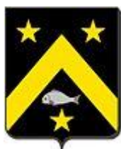
CANNEEL Het wapen van de familie Canneel

Van 1857 tot 1862 werkt hij aan de muurschilderingen van deze kerk. Nadien start hij met de muurschilderingen van de Sint-Annakerk. Het beschilderen van de 4.000 m 2 muur is een enorme klus die niet minder dan 29 jaar zal duren! Canneel zal het werk niet kunnen afmaken: hij overlijdt in 1892. Theofiel Lybaert, één van zijn leerlingen, zal er de laatste hand aan leggen.