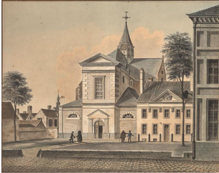
De kerk in 1820 door Wijnantz

Brochure opgesteld ter gelegenheid van Open Monumentendag en van de restauratie van de muurschilderingen van Theodoor Canneel