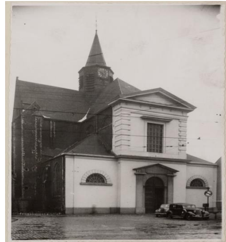
Heilig Kerst in 1940 (SAG)