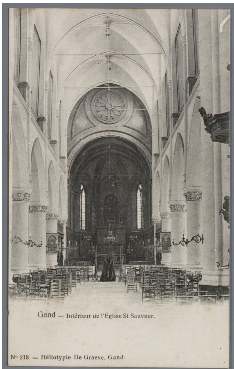
Binnenzicht van de kerk omstreeks 1900 (SAG)