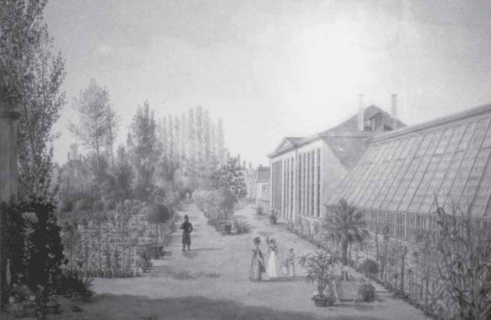
Een zeldzame foto van de grote wintertuin van Van Hoecke

ge tuinman, die met zijn tamelijk talrijk gezin een soort onderaardse krocht bewoonde, onder de gebouwen waar men les gaf aan de studenten