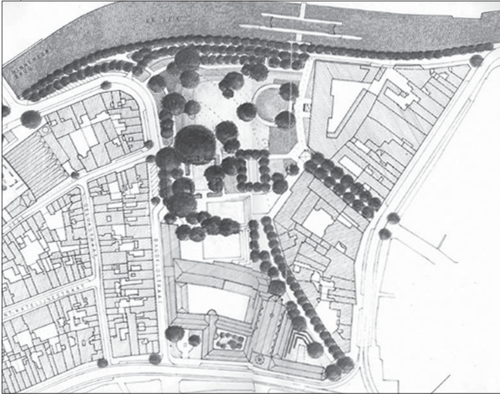
Een voorstel voor herinrichting van het Baudelohof na het verdwijnen van de Bibliotheekstraat.

noemd, en van de Bibliotheekstraat met haar eveneens historisch correcte maar voor velen nu onbegrijpelijke naam, werden ooit helemaal anders bekeken. We kunnen ons nu nog nauwelijks voorstellen hoe dat vroeger was. Daar zit heel wat geschiedenis achter. En die hebben we nodig voor een goed begrip van zaken.