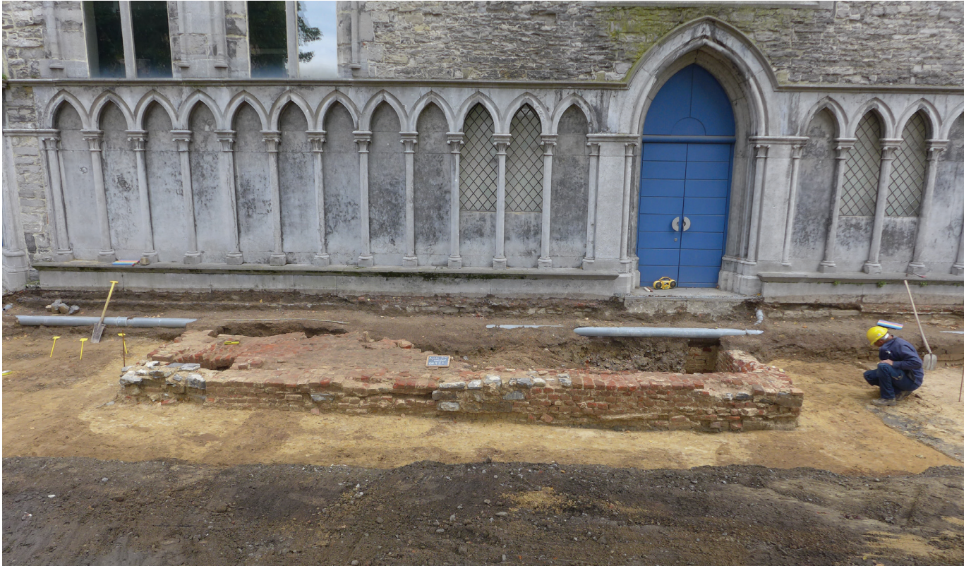
afb. 2: De opgegraven zone voor de kapel met de grafkelder, de donkere kerkhofzone en de verstoringen