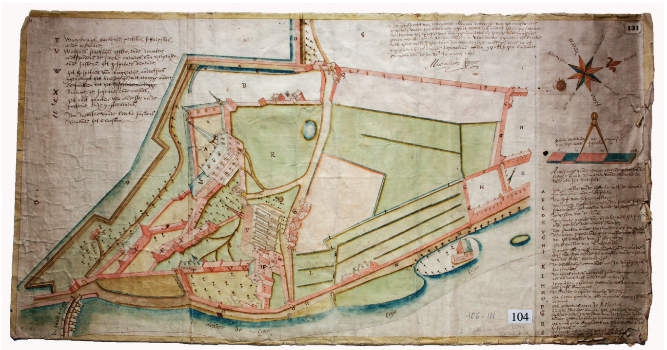
afb. 13: Kaart van de abdij en het hospitaal van de Bijloke en van de bijhorende gronden, Maximiliaan Reynax, panoramisch gezicht van 27 januari 1696 (Stad Gent, De Zwarte Doos, Archief Gent, IC_K_0104)

Voor de ziekenzaal lag het kerkhof en er werd tot tegen de gevel van de ziekenzaal en de kapel begraven. Archeologisch onderzoek door de stedelijke dienst uitgevoerd in 1990 in het kader van de reconversie van het gebouw tot concertzaal toonde aan dat er ook in de kapel begraven werd 6 .