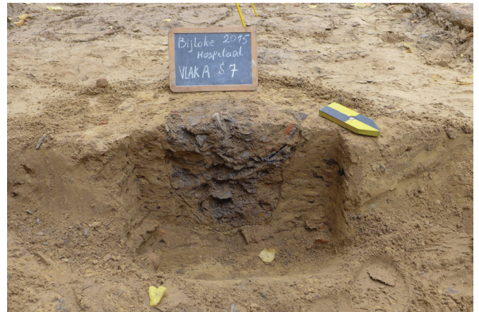
afb. 4: Doorsnede van een paalgat, waarschijnlijk voor de opbouw van een 19de-eeuwse steiger (Stad Gent, De Zwarte Doos, Stadsarcheologie)

De archeologisch interessante sporen bestonden uit een baksteenconstructie, waarschijnlijk een grote grafkelder, en bijzettingen verspreid over heel de vrijgelegde zone. Een negental kleinere ronde tot ovale verstoringen, waarvan de vulling bestond uit schilfers Doornikse kalksteen en fragmenten van leien bevonden zich op ongeveer 1,5 m langsheen de gevel en waren chronologisch jonger dan de bijzettingen (afb. 3, 4 & 5). Vermoedelijk zijn dit de paalgaten van een houten stelling die in de 19de eeuw geplaatst werd om aan de ziekenhuis- en kapelgevel te werken. Waarschijnlijk