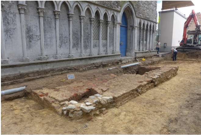
afb. 6: De grafkelder voor de kapelingang. Voor het bijwerken of dichtn van de ingang op de hoek vooraan werden vervangen gevelornamenten gebruikt (Stad Gent, De Zwarte Doos, Stadsarcheologie)