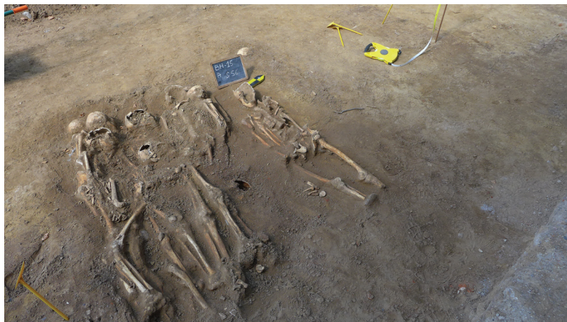
afb. 10: Massagraf voor de kapel

Van de negentien bijzettingen die gedocumenteerd werden, waren er onrechtstreekse aanwijzingen voor acht kistbegravingen. De elf andere lagen in verscheidene groepjes samen in kuilen. Op twee kistbegravingen na lagen alle individuen met de voeten naar het oosten. Mogelijk was de kist zo eenvoudig dat er uitwendig geen verschil tussen hoofd- en voeteinde was, en gebeurde dit per ongeluk. Ondanks dat er in kuil S40 minstens acht personen in de volle grond gelegd werden, kan men toch van enige zorg spreken; de positie op de rug en de oriëntatie werden gerespecteerd. Bij de drie doden in kuil S49 werden zelfs fragmenten Doornikse kalksteen aan het hoofdeinde gelegd.