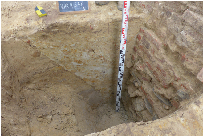
afb. 8: Aanlegsluif voor de grafkelder