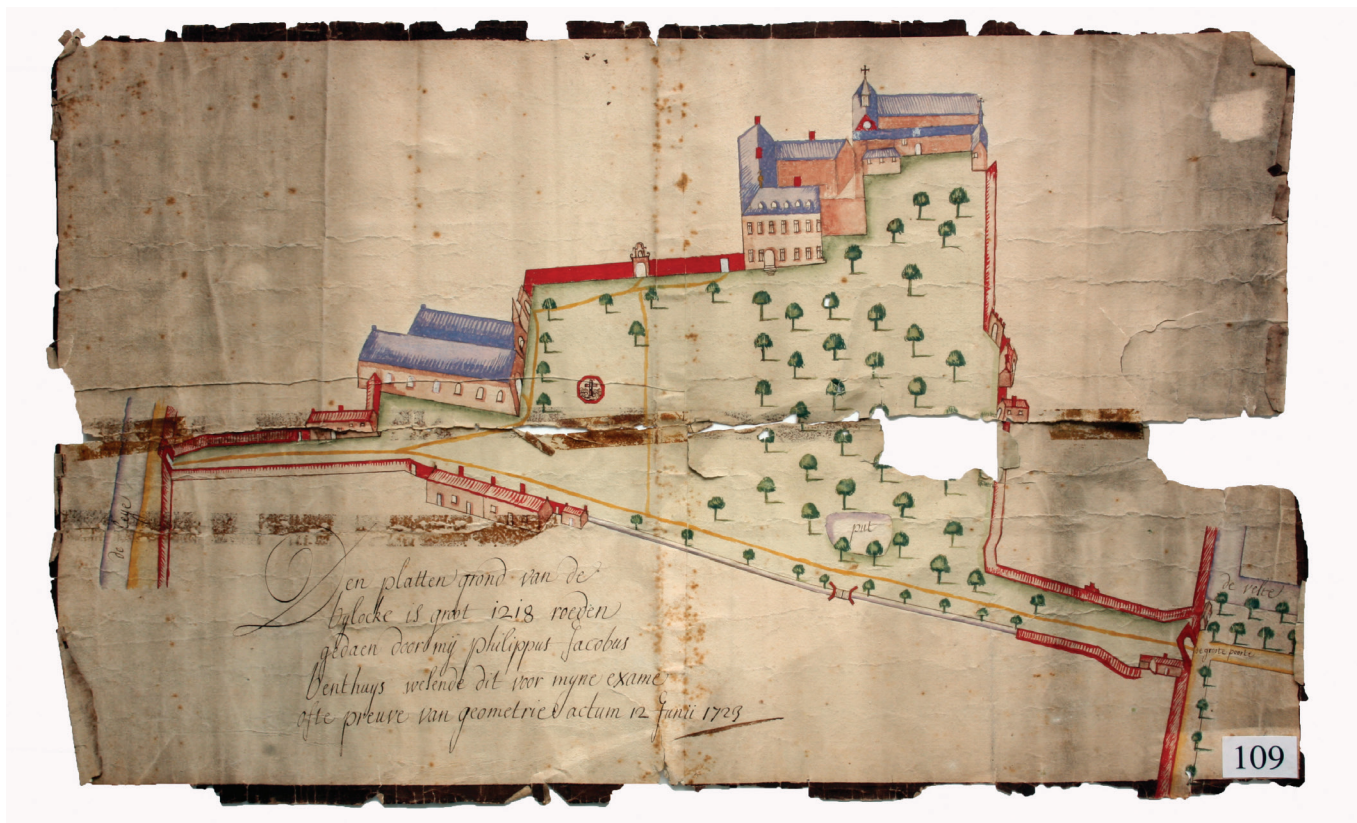
afb. 14: Plattegrond van de Bijloke, Philippus Jacobus Benthuis 12 juni 1723 (Stad Gent, De Zwarte Doos, Archief Gent, IC_K_0109)

De grafkelder voor de kapel kan, afgaande op het baksteenformaat, gedateerd worden op het einde van de 16de en het begin van de 17de. De oude abdijkerk 7 werd in de tweede helft van de 16de eeuw vernield tijdens de beeldenstormen, waarna het noordelijke deel van de oostvleugel van de abdij werd omgebouwd tot nieuwe abdijkerk. In die periode deed de hospitaalkapel tijdelijk dienst als bidplaats voor de cisterciënzerinnen. Dit ging gepaard met enkele wijzigingen aan het gebouw waarbij hetzelfde baksteenformaat gebruikt werd. Mogelijk zijn zij ook de opdrachtgevers voor deze grafkelder en werd die tijdens het gebruik van de hospitaalkapel als bidplaats, voor het bijzetten van overleden cisterciënzerinnen gebruikt. De doden uit de abdij werden zeker gedurende een periode ook binnen het abdijsaal begraven, namelijk in de noordoosthoek van de huidige boomgaard, tegen de muur die de scheiding vormde tussen burgerlijk hospitaal en abdij 8 .