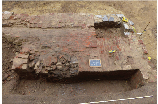
afb. 7: De noordkant van de grafkelder met in de noordwesthoek de bijgewerkte ingang