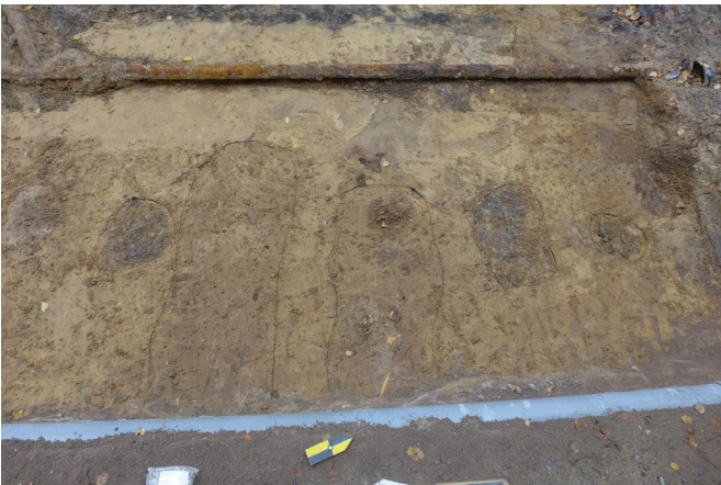
afb. 3: Aflijning van twee kuilen van begravingen en vier eerder ronde kuilen waarin waarschijnlijk de steigerpalen voor de 19de-eeuwse restauratie stonden. Op de voorgrond de afvoerbuis die voor een verstoring langsheen de hele gevel zorgde (Stad Gent, De Zwarte Doos, Stadsarcheologie)