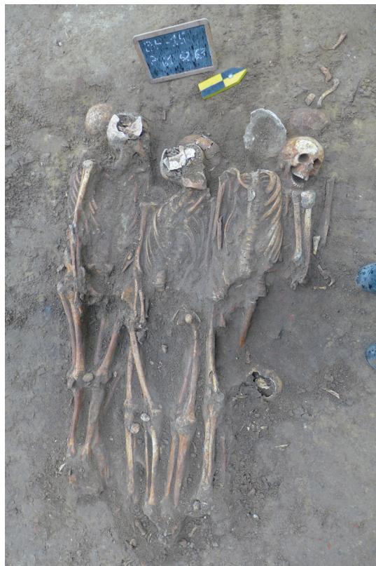
afb. 11: Massagraf voor de kapel