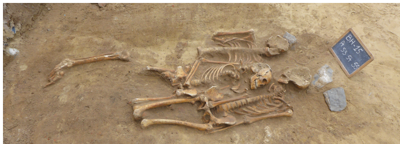
afb. 12: Bijzetting van drie individuen met een steen aan het hoofd (Stad Gent, De Zwarte Doos, Stadsarcheologie)