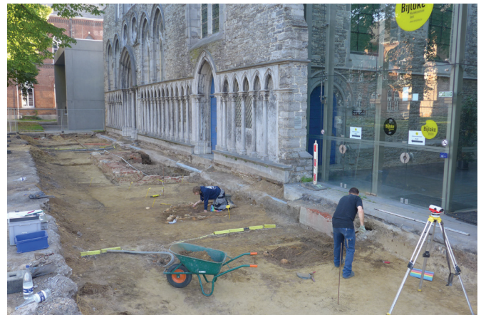
afb. 9: Het vrijleggen van begravingen voor de ziekenzaal en kapel

De bakstenen constructie S4 bevond zich tegen de ziekenzaalgevel en deels ook voor de kapel en was opgebouwd uit bakstenen (23,5/24,5 cm x 11,5 cm x 5 cm) met hier en daar en vooral in de noordwesthoek herbruikte Doornikse kalksteen (afb. 6). Dit baksteenformaat is ook terug te vinden in de uitbreidingen van de abdijgebouwen die in de tweede helft van de 17de eeuw gerealiseerd werden. De tweede ziekenzaal, het Craeckhuys 5 , uit het eerste kwart van de 16de eeuw is nog opgetrokken in een groter formaat (25/25,5 x 11,5 x 5/5,5 cm). De volledige lengte van de constructie bedroeg 8,5 m en de breedte ca. 3,4 m. Binnenwerks gaf dat een ruimte van 3,0 m bij 7,76 m. Het geheel was in de lengte overwelfd met een tongewelf, behalve de ingangspartij in het noorden. De hele oostzijde van het gewelf was doorbroken door recentere ingrepen en de ruimte was met puin opgevuld. Aan de noordzijde steunde een half tongewelf (de westkant) op een boog die vanaf de noordmuur naar een vierkante steunzuil in de kelder liep (afb. 7). De laatste 0,95 m in de noordwesthoek had een tongewelf