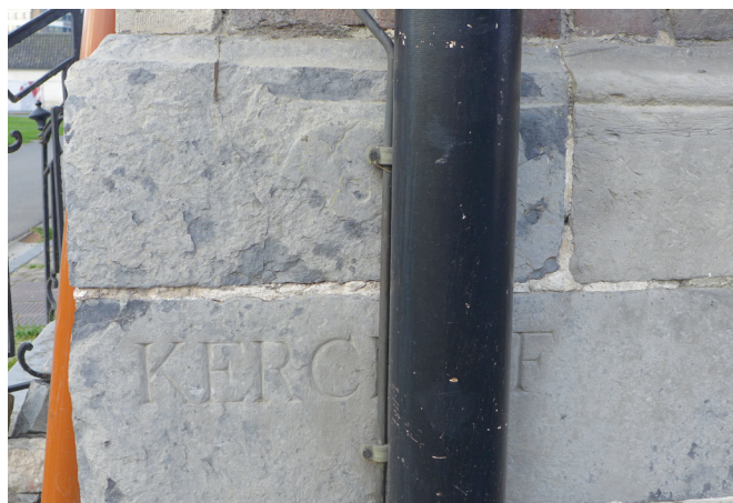
afb. 15: De tekst 'KERCHOF' en erboven een doodskop op de hoek van het 17de-eeuwse abdijgebouw, weliswaar deels geschonden en verborgen door recente ingrepen (Stad Gent, De Zwarte Doos, Stadsarcheologie)

Naast de grafkelder kwamen zowel bijzettingen in een kist als in volle grond voor. Naast enkele individuele kuilen kon vastgesteld worden dat bij de meeste begravingen meerdere kisten of individuen zonder kist samen in een kuil waren gelegd. Dit heeft waarschijnlijk met het hoge sterftecijfer te maken, of met sterftepieken tijdens een epidemie. Toch werd er telkens een minimale zorg aan doden besteed en werden enkele basisgebruiken niet over het hoofd gezien.