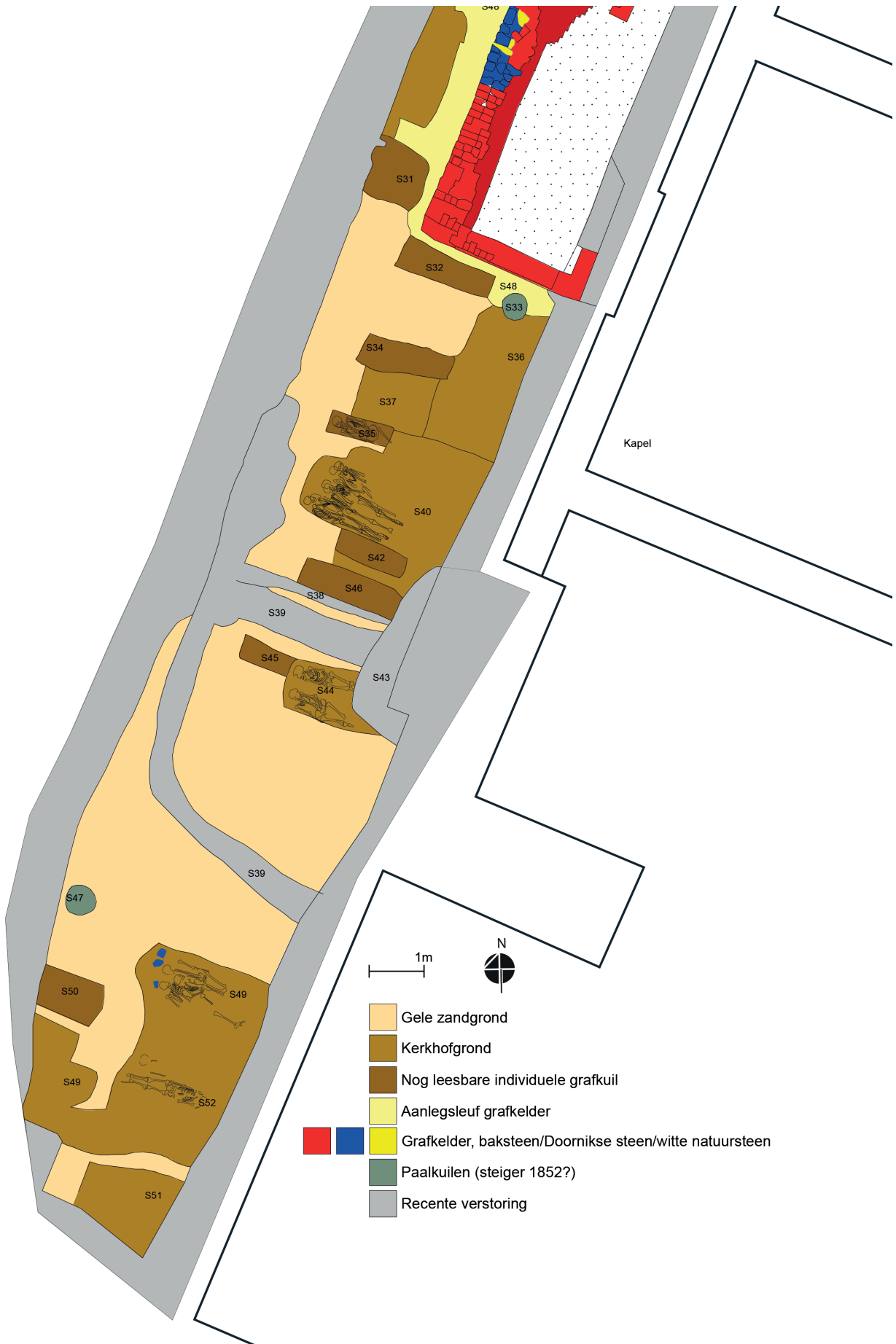
afb. 5: Overzichtsplan van alle sporen en doorsnede van een paalgat uit de 19de eeuw en de aanlegsleuf voor de grafkelder (Stad Gent, de Zwarte Doos, Stadsarcheologie)